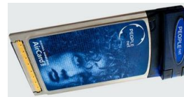
Data Card Sierra Wireless AC 580 745 грн