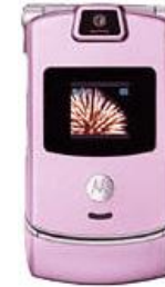
Motorola RAZR V3c pink 1545 грн