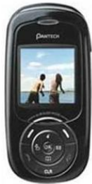
Pantech PC-7300 495 грн