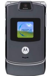
Motorola RAZR V3c grey 1495 грн